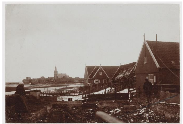
Figuur 1 Na de brand